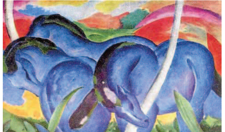
Links das Aquarell im Besitz von Tomeu L'Amo. Zum Vergleich rechts die Bilder „Die großen blauen Pferde“ (1911) und „Rotes und blaues Pferd“ (1912) von Franz Marc.